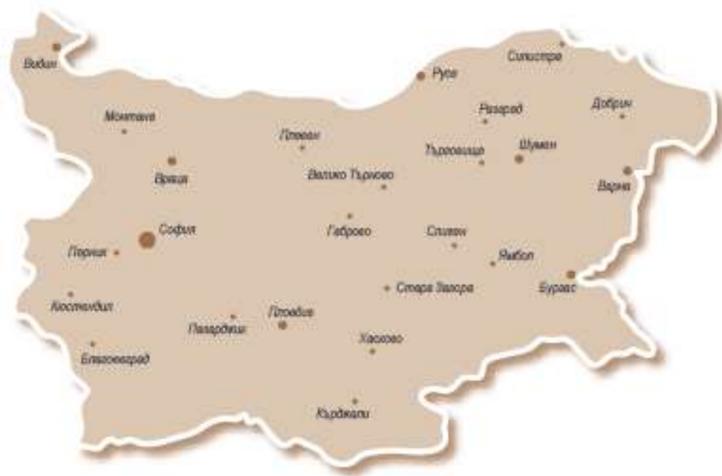
Разпределение и брой на частните съдебни изпълнители на територията на Република България по съдебни райони на действие